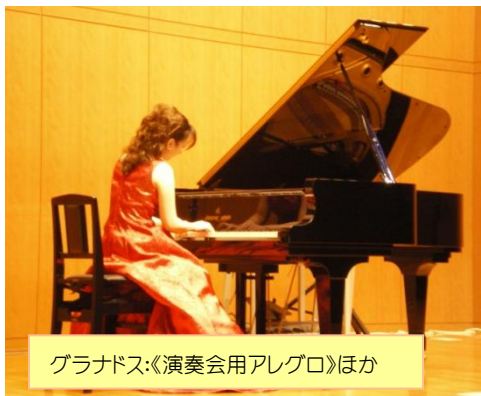
グラナドス:《演奏会用アレグロ》ほか