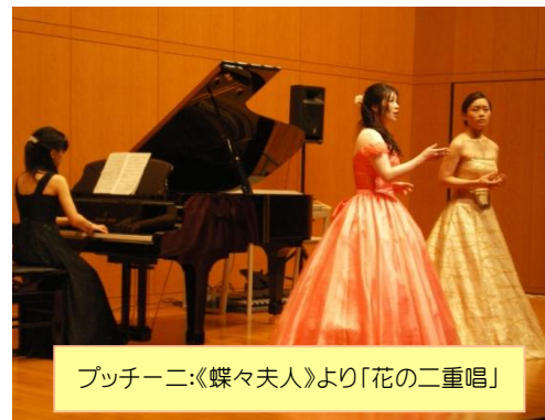
プッチーニ:《蝶々夫人》より「花の二重唱」