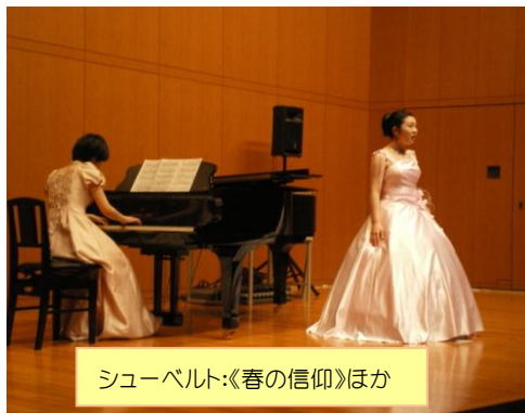
シューベルト:《春の信仰》ほか