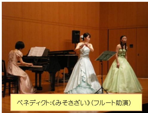
ベネディクト:《みそさざい》(フルート助演)