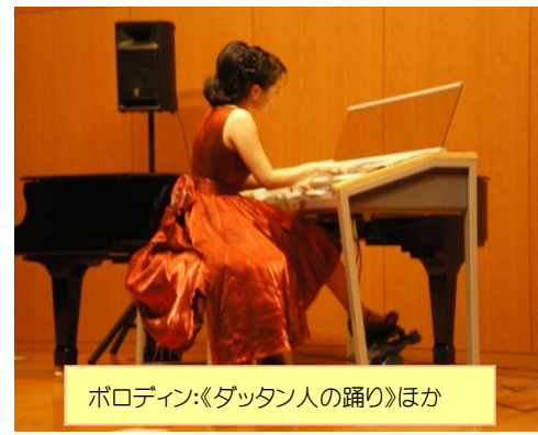
ボロディン:《ダツタン人の踊り》ほか