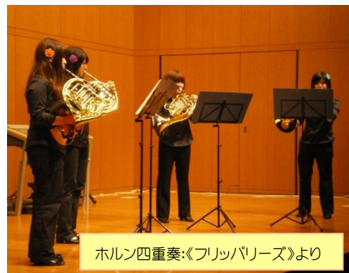
ホルン四重奏:《フリッパリーズ》より