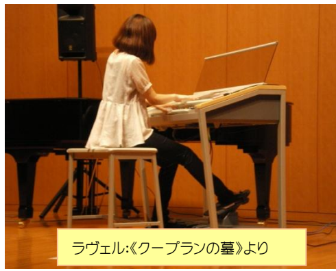
ラヴェル:《クープランの墓》より